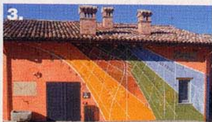
3. e 4. La meridiana, un particolare della facciata del "Podere Terravera", sotto un'immagine del villaggio