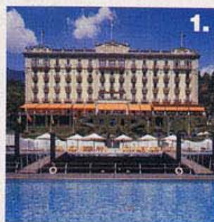
1. e 2. Il grand hotel Tremezzo Palace: la facciata e gli splendidi giardini

Vi piace il 'gardening' e il vostro attore preferito è George Clooney? Con la scusa di ammirare le fioriture che incorniciano le ville storiche dell'aristocrazia sul lago di Como, potete convincere vostro marito a mettere da parte la gelosia e a portarvi in 'pellegrinaggio' a Laglio (dove l'eroe di Ocean's Twelve possiede 3 ville) con il preciso scopo di incontrarlo. Fino a maggio è valido il pacchetto primavera del Grand Hotel Tremezzo Palace. Comprende due pernottamenti, due prime colazioni, cocktail di benvenuto, due cene a lume di candela, due biglietti per la visita ai giardini di Villa Carlotta e un cesto di frutta in camera. Il costo è di 280€ per persona in camera vista giardino e di 320€ in camera vista lago. Info: Grand Hotel Tremezzo, tel. 0344/42491; www.grandhoteltremezzo.com .