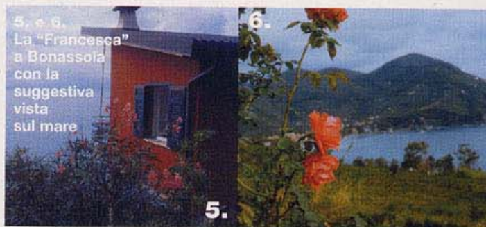
5. e 6. La "Francesca" a Bonassola con la suggestiva vista sul mare

Bastano pochi giorni per ritrovare le energie. Una destinazione ideale è il villaggio "La Francesca" di Bonassola, La Spezia, che in aprile offre un programma per disintossicare l'organismo, adatto alle future mamme. Il trattamento prevede tisana drenante, esercizi di yoga e massaggio. Il prezzo per un giorno è di 130€ a persona con trattamento di mezza pensione. L'offerta weekend da due notti costa invece 240€. Info: Villaggio La Francesca, tel. 0187/813911; www.lafrancesca.org