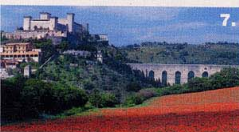
7. Spoleto con il tipico acquedotto romano